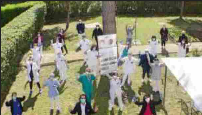
Residenza "S.Vitale" di San Salvo