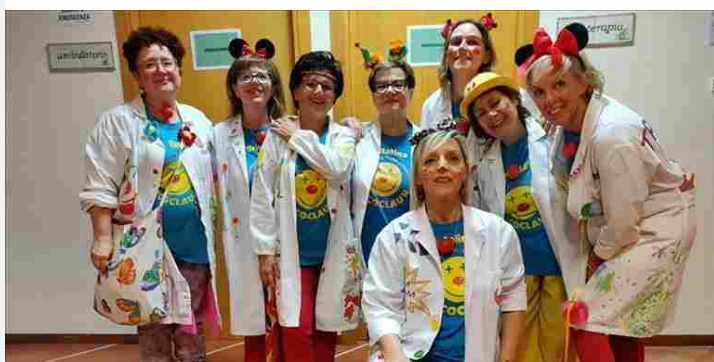
La clownterapia Ricoclaun porta allegria anche al San Vitale a San Salvo

V ASTO. Da oggi inizia una nuova collaborazione tra l'O.d.v. Rioclaun e la EDOS s.r.l. che ha in gestione la R.S.A "San Vitale" a San Salvo, per portare almeno una volta al mese l'attività di clownterapia Ricoclaun agli anziani ricoverati.